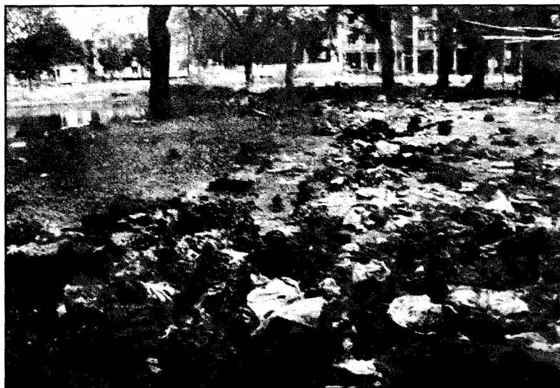
BDR jawans fled away leaving their official uniforms