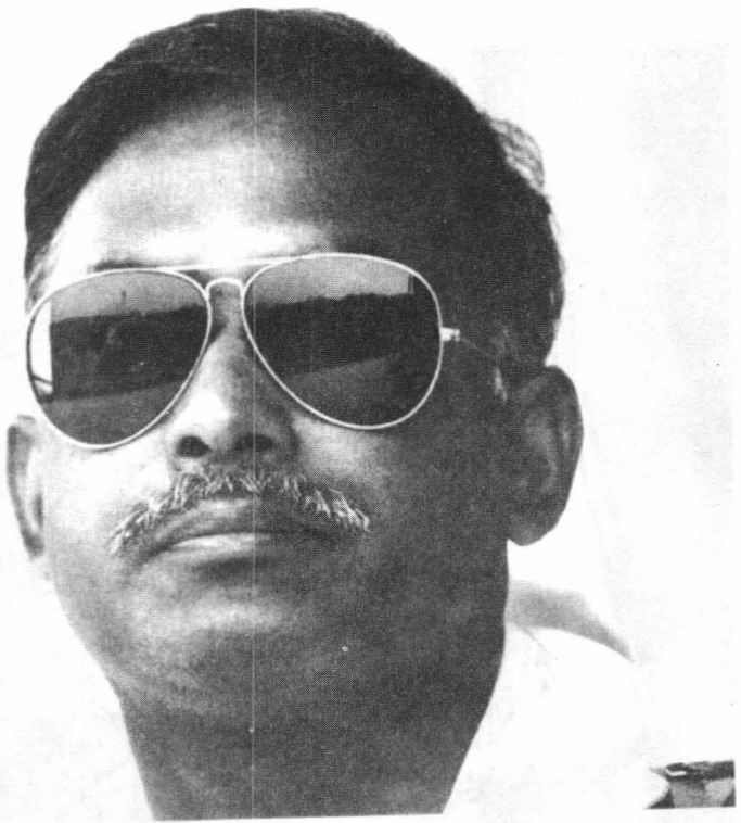
২। ঘাতকদের হাতে নিহত প্রেসিডেন্ট জিয়াউর রহমান।